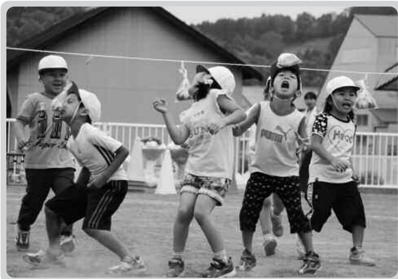
6月16日 和寒保育所運動会