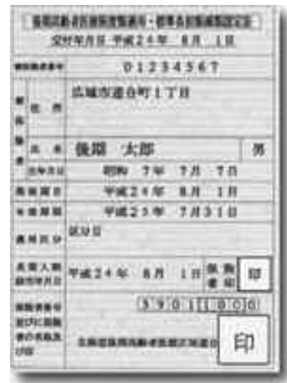
(色はオレンジです)