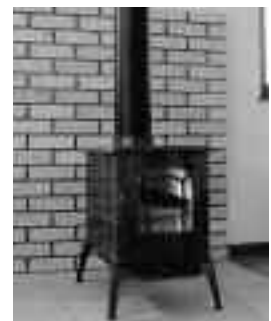
一般住宅に設置されたブリケットストーブ

ペレットやブリケットなどの木質バイオマス燃料は、燃焼中にCO 2 を排出しますが、原料である樹木は成長過程でCO 2 を吸収しているため、トータルで見ると大気中のCO 2 を増やさない、環境にやさしい燃料です。