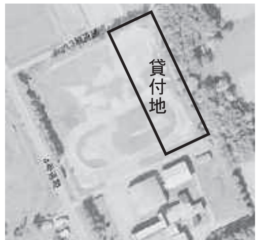
旧中学校跡地の航空写真

ベビーリーフとは発芽後10~30日程度の若い葉菜の総称 今回水戸菜園では、8種類程度の葉菜の栽培を計画しています。