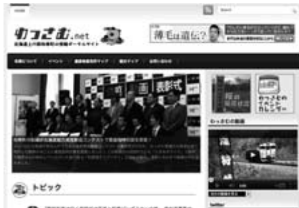
▲さまざまな情報を発信する「わっさむ.net」

和寒町の各種イベント等の情報を発信するホームページを開設し、約2万人ものアクセスがあり、ITを通しての地域の活性化が図られるものとなりました。