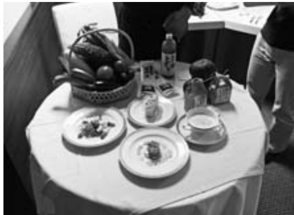
▲ホテルオークラ札幌で利用された夏野菜

和寒町の新鮮な夏野菜を札幌のホテルでPRし、和寒町を多くの方々に知っていただく有意義な機会となりました。