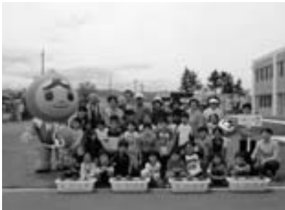
「人権の花」運動で一緒に花の苗を植えました