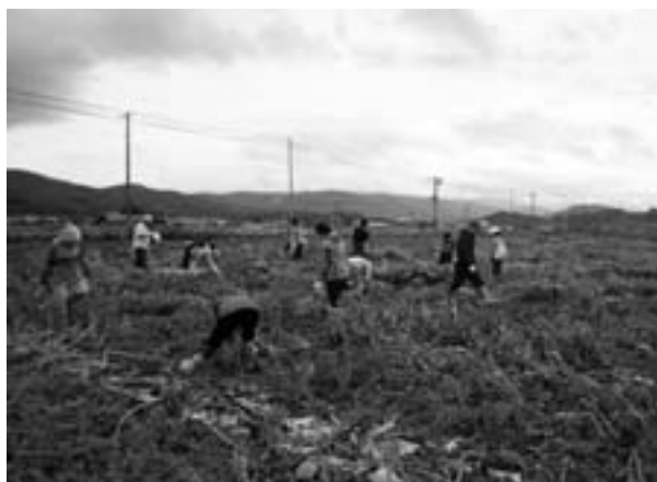
▲カボチャの収穫体験