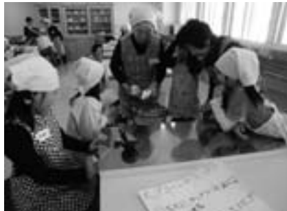
ポップコーン作りにも参加しました