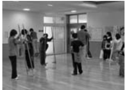
和小っ子祭りで竹馬遊び