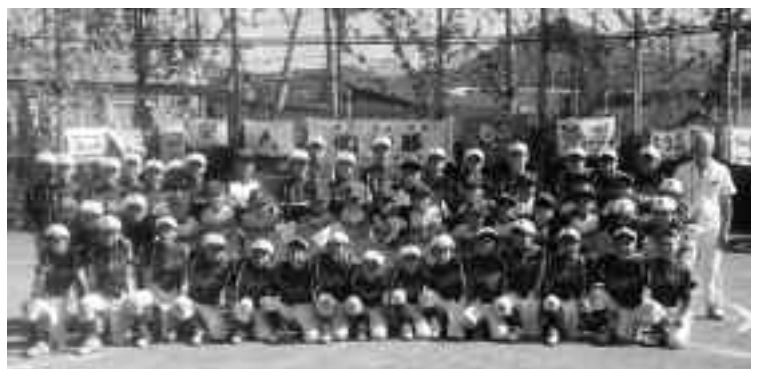
試合後西野ファイターズと記念写真