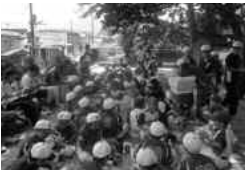
両チームで楽しく昼食

子どもたちは、試合や昼食交流会をとおしてすぐうちとけ、帰る頃には名前呼び合うほど仲良しに。参加した子どもたちからは「試合には負けて悔しいけどすごく楽しかった。もっとやりたい」「日頃対戦できない札幌のチームと対戦できて友達にもなれてよかった」との感想があり、夏の思い出に残る交流となりました。