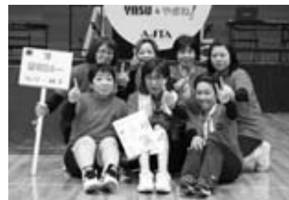
←シニアの部優勝のチーム「榮和DA~」(和寒町)