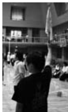
←和寒中学校生徒(35名)も競技役員ボランティアとして大会運営をお手伝い