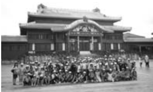
首里城の前で記念撮影