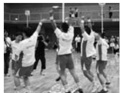
一般の部優勝の瞬間ガッツポーズのチーム「DADAI S」(大阪府)