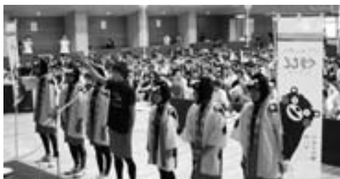
熊本県から出場のチーム「くまもん」によるユニークな選手宣誓