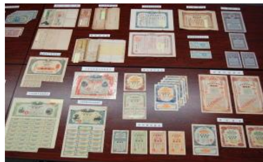
税関で保管している紙