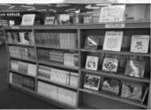
バリアフリーコーナー

今年度、図書館ではバリアフリーコーナーを設置しました。読書をしたけれど、文字が小さくて目が疲れる...とあきらめてはいませんか? バリアフリーコーナーでは、大活字本を多く取り揃えているほか、今年度初めて朗読CDが館外貸出可能になりました。耳で聴く読書をぜひこの機会にお楽しみください。