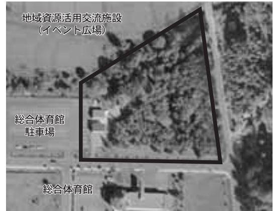
総合体育館東側の町有地