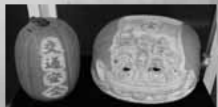
金賞の「交通安全七福神」和寒駐在所

ランタンコンテストは、商工会商業部会が中心となり、かぼちゃランタンまつり実行委員会主催で開催されています。今年は37作品の応募がありました。