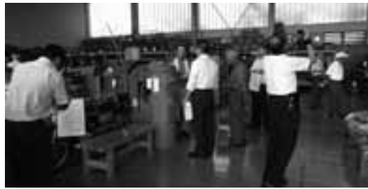
鷹栖町郷土資料館の視察の様子