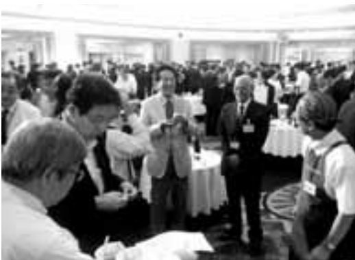
(東京都文京区：ホテル椿山荘)