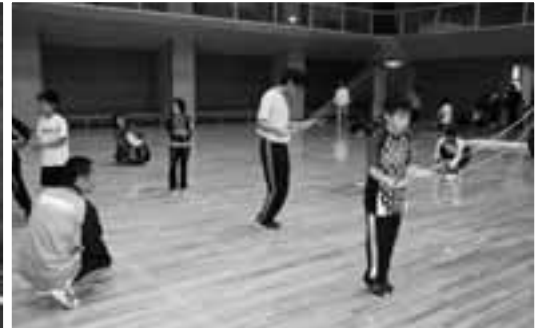
10/6 町民スポーツチャレンジデー 町民ロードレース大会