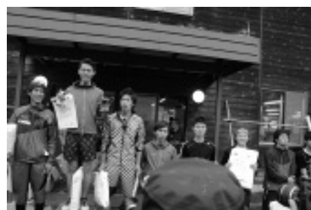
サマージャンプ大会での6位入賞の様子

8月～9月は全日本の合宿やサマーグランプリヨーロッパ大会に遠征し、冬の本番に向け、調整は順調のようです。