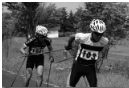
サマーコンバインド大会での様子