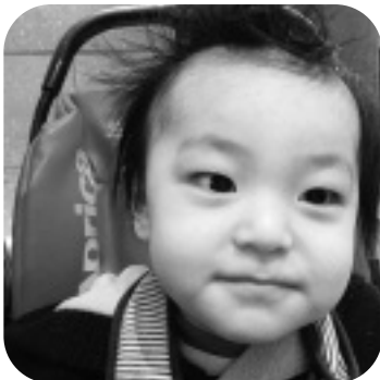
や 俊 哉くん しゅん や 俊 哉くん

ぼくの名前は「れんと」と言います。とにかくパワフルで力では負けないぞ！得意技は、短い足でするキックなんだ。歌も大好きでマイクとギターを持ってきてノリノリで歌っちゃうんだ♪いつもオチャメなことをしてみんなを笑わせてるよ♡こんなぼくだけど、みんな仲良く遊んでね！