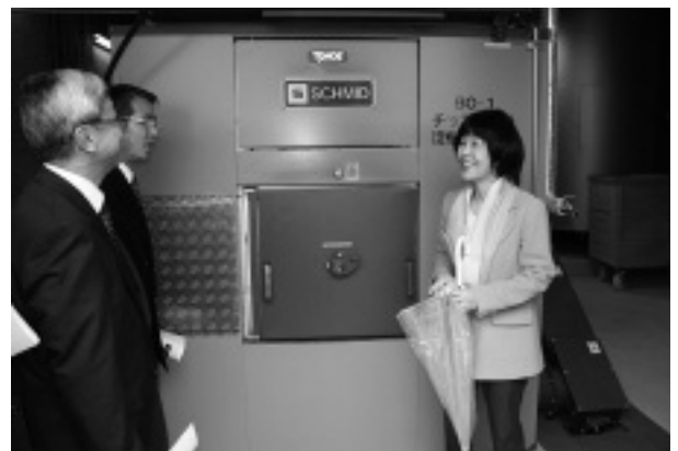
熱源供給施設を見学する高橋知事