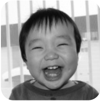
と 蓮 翔くん れん と 蓮 翔くん