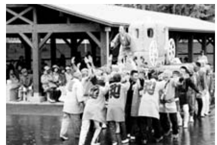
雨の中会場を練り歩いた南瓜みこし