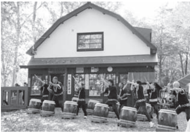
JRの到着にあわせて塩狩太鼓で来場者を歓迎

フェスタでは、「塩狩峠の道」と名付けられたフットパスコースの散策や塩狩峠記念館内での朗読劇、記念館周辺でのジンギスカンコーナーや特産品販売ブースなど、300名の来場者が小説の舞台「塩狩峠」の自然を満喫しました。