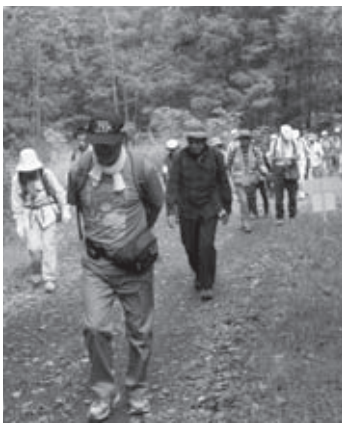
小説の舞台を踏みしめ、夫婦岩をめざす参加者

来場者の主な目的のフットパスには100名以上が参加し、短距離、中距離、長距離の3つのコースで自分の体力に合わせて散策を楽しんでいました。すでに開催された上富良野町の「泥流地帯の道」や旭川市の「氷点の道」にも参加した方は、3市町全てのフットパス完歩証明スタンプを集め、爽やかな達成感に浸っていました。