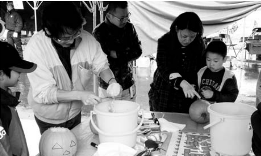
カボチャランタンづくり