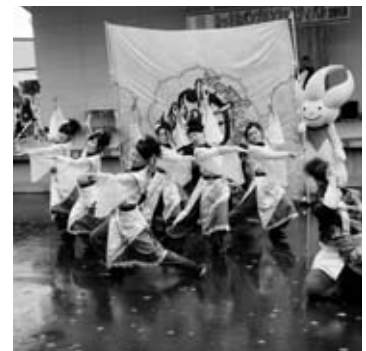
よさこいの演舞中は 雨が上がりました