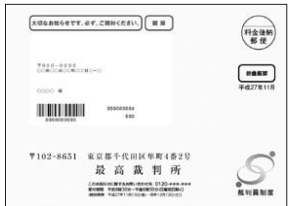
候補者に送られてくる封筒

平成27年には、6,767名の方が裁判員として裁判に参加し、1,104件の判決が言い渡されています。