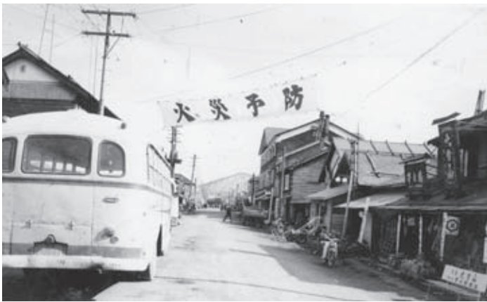
かつての大通り商店街の様子（昭和36年）