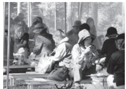
フットパスのあとは特設会場で和寒ジンギスカンを堪能