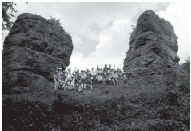
フットパス参加者が無事に夫婦岩までたどり着き、記念に1枚