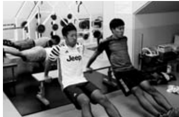
総合体育館での筋力トレーニング

コーチからは「この中から間違いなく平昌五輪（ピョンチャンオリンピック）に出場する選手が出ますので応援よろしくお願ひします」とお話しいただきました。