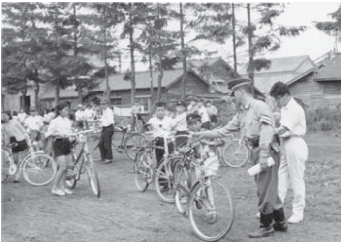
和寒小学校 自転車運転免許テスト（昭和37年）

11月30日(水)は、町税（町道民税・固定資産税・国民健康保険税）の最終納期限です。