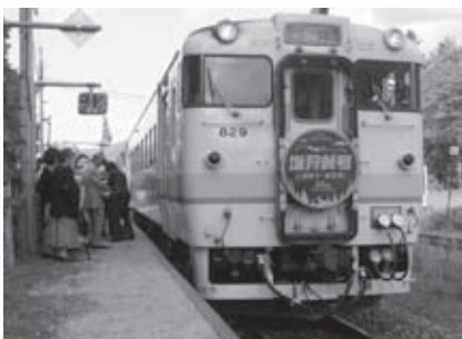
臨時列車にはこの日限定のヘッドプレートが

来場者の主な目的のフットパスには100名以上が参加し、短距離、中距離、長距離の3つのコースで自分の体力に合わせて散策を楽しんでいました。すでに開催された上富良野町の「泥流地帯の道」や旭川市の「氷点の道」にも参加した方は、3市町全てのフットパス完歩証明スタンプを集め、爽やかな達成感に浸っていました。