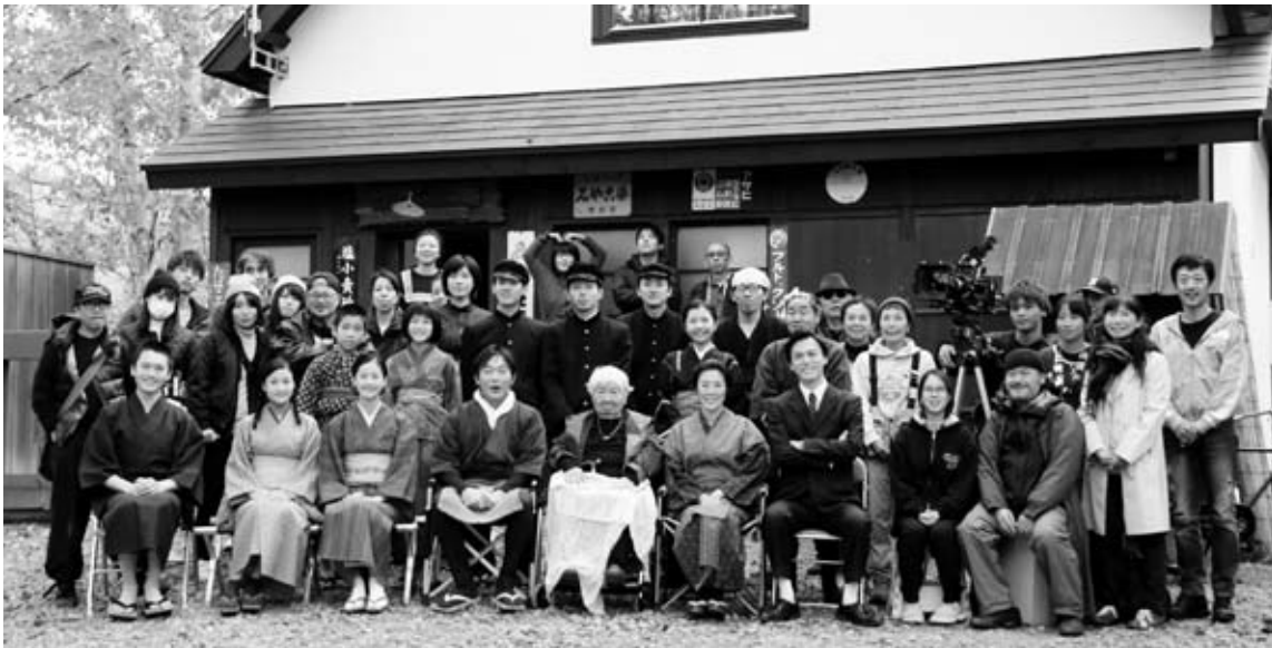
撮影終了後にキャスト・スタッフ全員で記念撮影