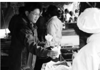
カボチャクレープ