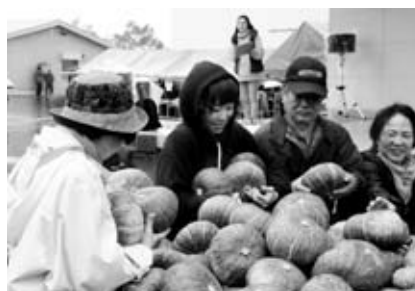
カボチャつかみどり