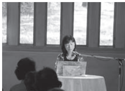
三浦綾子さんが小説を執筆した場所でしっかりと朗読劇