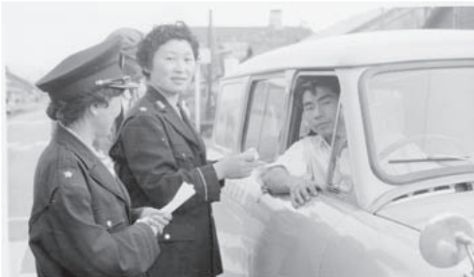
婦人1日警察官(昭和36年)