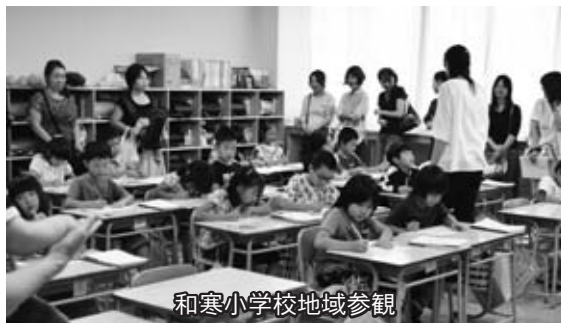
和寒小学校地域参観