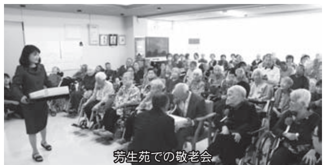
芳生苑での敬老会