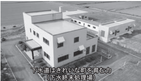
下水道はきれいな町を育む力 (下水終末処理場)