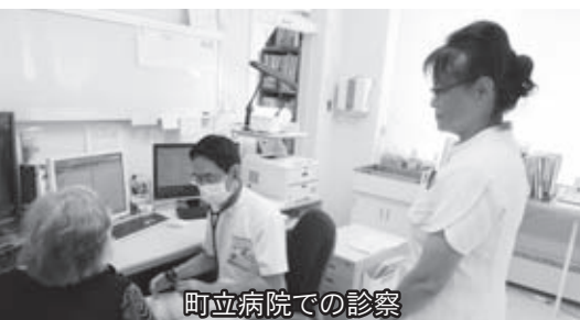
町立病院での診察