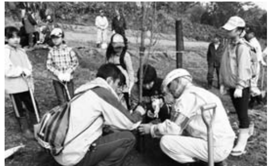
三笠山で開催した町民植樹祭