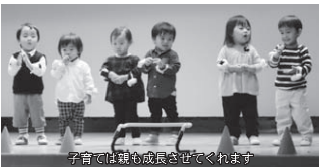
子育ては親も成長させてくれます