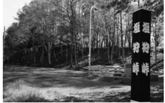
観光客が訪れる塩狩峠駅周辺