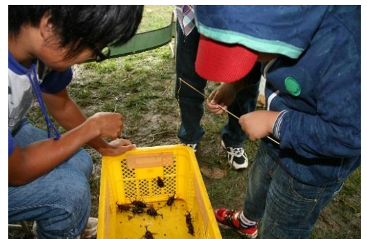
「どんとこい！わっさむ夏まつり」の カブト虫1本釣り