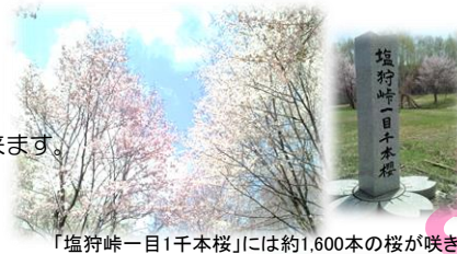
「塩狩峠一目千本桜」には約1,600本の桜が咲き誇る

日時：5月12日(金) 会場：ふれあいのもり 夜桜を觀賞しながら「和寒ジンギスカン」を堪能出来ます。 抽選会・カラオケ大会も開催されます。 お問い合わせ先：和寒町観光協会 TEL 0165-32-2341