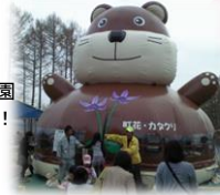
三笠山自然公園 こどもの国で遊ぶ!

日時：7月16日(日) 会場：わっさむサーキット 北海道では唯一和寒町で開催され、日本トップクラスのライダーが集結し、バイクテクニックを競い合います。 お問い合わせ先：和寒町産業振興課(主催：MFJ北海道)