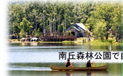
南丘森林公園で自然満喫!

日時：7月30日(日) 会場：ふれあいのもり お子様に大人気のカブト虫王国をはじめ、移動動物園や焼き肉、屋台等もあり、ご家族・ご友人と一日中お楽しみ頂けます。 お問い合わせ先：和寒町観光協会 TEL 0165-32-2341