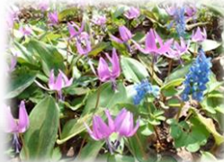
町花「カタクリ」とエゾエンゴサク

日時：平成30年2月4日(日) 会場：ふれあいのもり 越冬キャベツの販売や地獄鍋など、和寒の冬と食を存分に体感できるお祭りです。 お問い合わせ先：和寒町観光協会 TEL 0165-32-2341