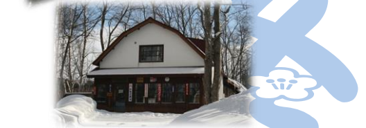
作家故三浦綾子さんの旧宅を、代表作小説「塩狩峠」の舞台に復元