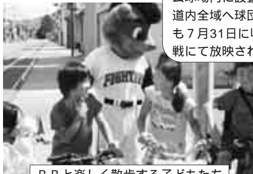
B Bと楽しく散歩する子どもたち