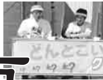
【クイズグランプリ】 なかなか難しいなあ