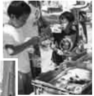
【カプトムシ1本釣り】 上手に釣れたよ！

7月28日(土)・29日(日)に【第5回 どんとこい！わっさむ夏まつり】が行われました。今年も町内外から多くの方が来場され、真夏の太陽を体全体で浴びながら「カプトムシ1本釣り」や「クイズグランプリ」などたくさんのイベントを満喫していました。