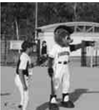
B Bと野球少年団との交流

【 ビビ B B 2 1 2 物語】とは、球団マスコットであるB B(熊をモチーフ)が道内2 1 2市町村を7年かけて全て訪問し、各地の名所の紹介や地元の方々と触れ合う様子を札幌ドーム公式戦でドーム球場内に設置している大型ビジョンで放映し、道内全域へ球団PRを目的とした企画です。本町も7月31日に収録を終え、9月8日(土)の公式戦にて放映されます。