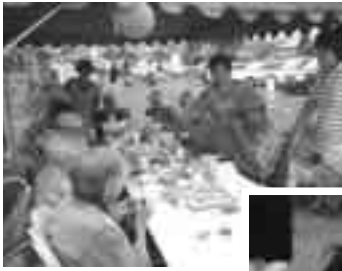
たくさん食べてくださいね。

7月25日(水)に芳生苑において、各方面からのご協力をいただきながら、「ちっちゃな夏まつり」が開催されました。芳生苑・健楽苑のご利用者の皆さんは、焼きそばやおでんなどに舌つつみをうち、ひ孫のような子どもたちに目を細めながら楽しいひとときを過ごされていました。