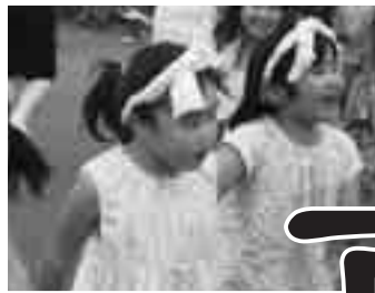
さあ、踊りに行ってみようよ。

7月28日(土)・29日(日)に【第5回 どんとこい！わっさむ夏まつり】が行われました。今年も町内外から多くの方が来場され、真夏の太陽を体全体で浴びながら「カプトムシ1本釣り」や「クイズグランプリ」などたくさんのイベントを満喫していました。