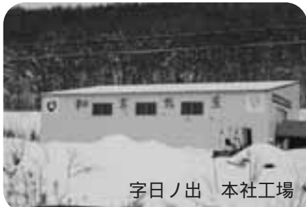
字日ノ出 本社工場

黄将(カボチャペースト)は第36回大阪インターナショナルギフトショー秋2006で【グルメギフトコンテスト大賞】を受賞しており、新しい和寒の特産物として期待されます。