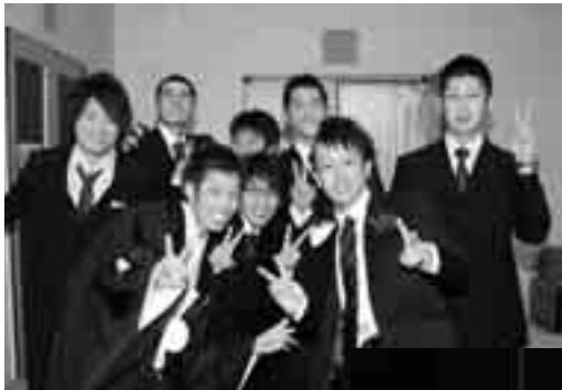
久々の再開にピースサインで