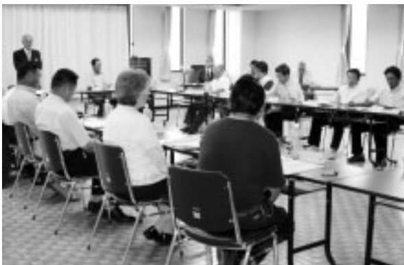
第1回町民会議の様子（7月6日）