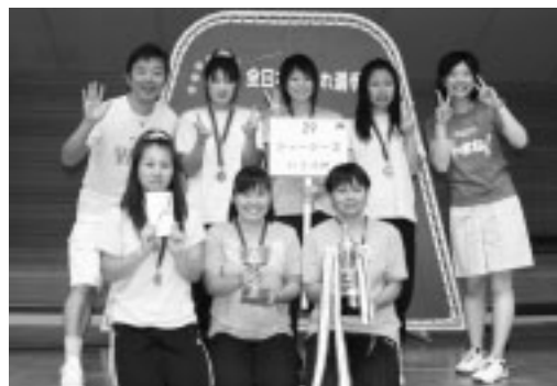
レディースの部で優勝した『ジャージーズ』