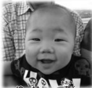
あおい 葵くん 嶋村