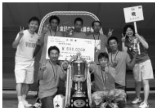
一般の部で2年連続優勝した『暁』