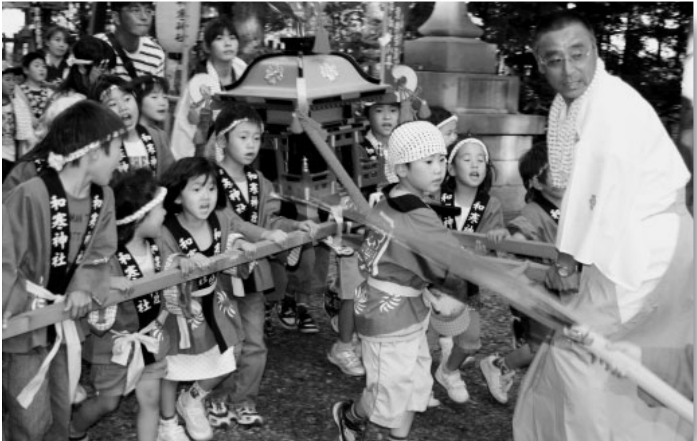
8月25日 和寒神社例大祭でお神輿を担ぐ子どもたち