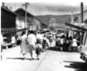
昭和34駅前通り祭典の様子