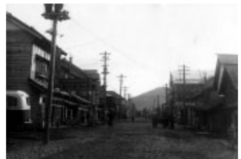
昭和24年の大通りの様子