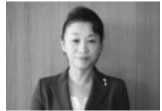
浜田友子教育委員長