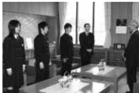
3月1日(月) 出場報告を行う3選手