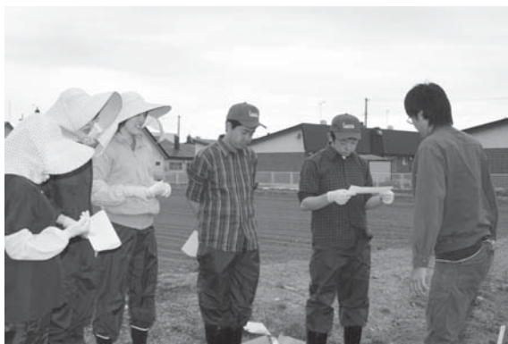
農想塾ではじめての農作業の説明を受ける実習生