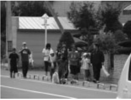
小中連携ボランティアの様子

小中連携ボランティアは、9月2日(木)和寒小学校グラウンドに集合して行われました。このボランティ