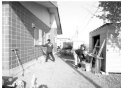
若草自治会館清掃作業

来年以降も皆さんに喜んでもらえるよう自治会館の清掃と周辺清掃を継続していきます。