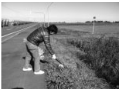
環境美化活動の様子

わっさむ担い隊としての活動についてですが、9月以降は高齢者住宅の見回りや図書館での手伝い、町有林のつる切り、農家さんでの研修、農業活性化センターでの研修、道路清掃など行いました。うれしいことに活動を通して町民のかたがたとのつながりも広がってきました。