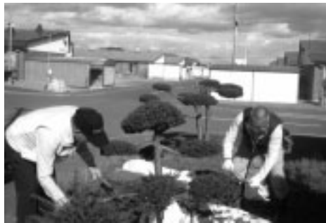
もみじ集会所清掃作業

自治会のかたがたをはじめ多くのかたから好評を受け、大変うれしく思っています。来年以降も続けていきます。