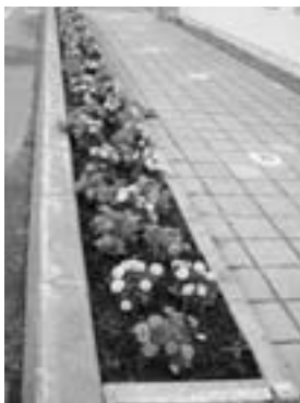
仲町自治会 フラワーロード

来年度は全ての自治会において花苗、プランター等の支援を行い、花壇造成や花作り活動を推進していきたいと考えていますので、ご協力よろしくお願いたします。