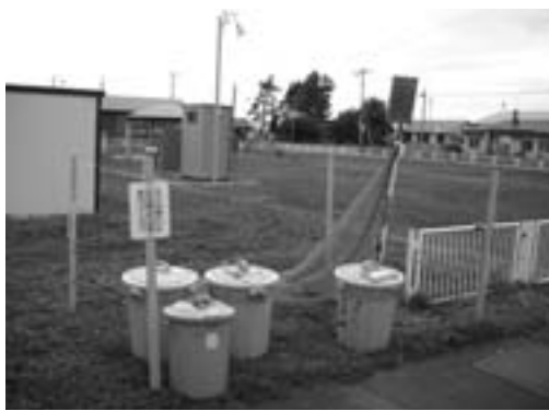
かたくり自治会 ごみステーション

設置に係る資材は住民課環境衛生係で準備しておりますので、ご協力よろしくお願いたします。