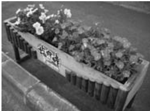
国道40号沿い ペチュニアの花台

現在89名の会員で構成されており、6月から10月までの4ヶ月間、国道40号沿いに設置してある花台に128個のプランターを設置し、当番制で手入れや水やりを行ないました。