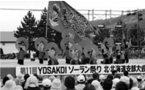
8月 第11回YOSAKOIソーラン祭り 北北海道大会が和寒町で開催