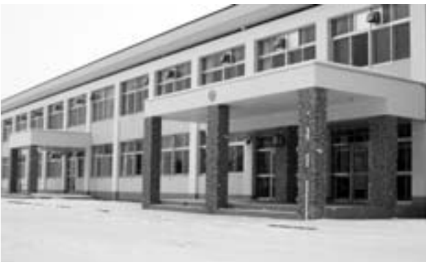
12月 引っ越しを終え、3学期の始業式(1/17) を待つ和寒中学校新校舎