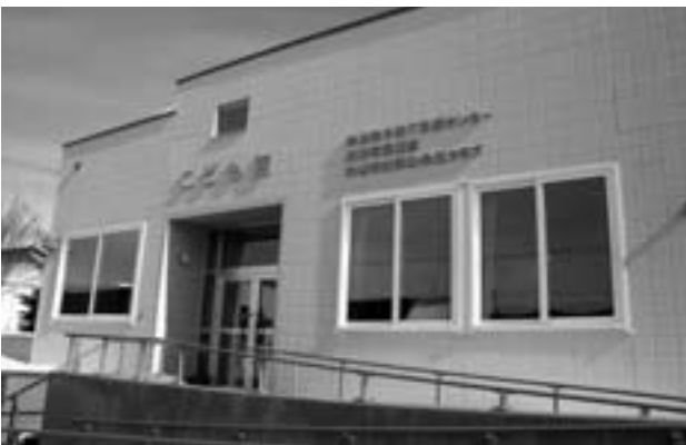
4月 子育て支援センター「こども館」オープン