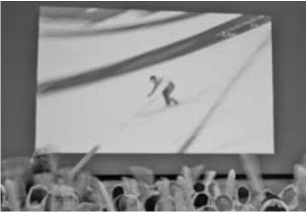
2月 加藤大平選手バンクーバーオリンピック出場 恵み野ホールで応援会開催