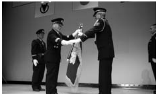
9月 和寒消防団創立100周年記念式典