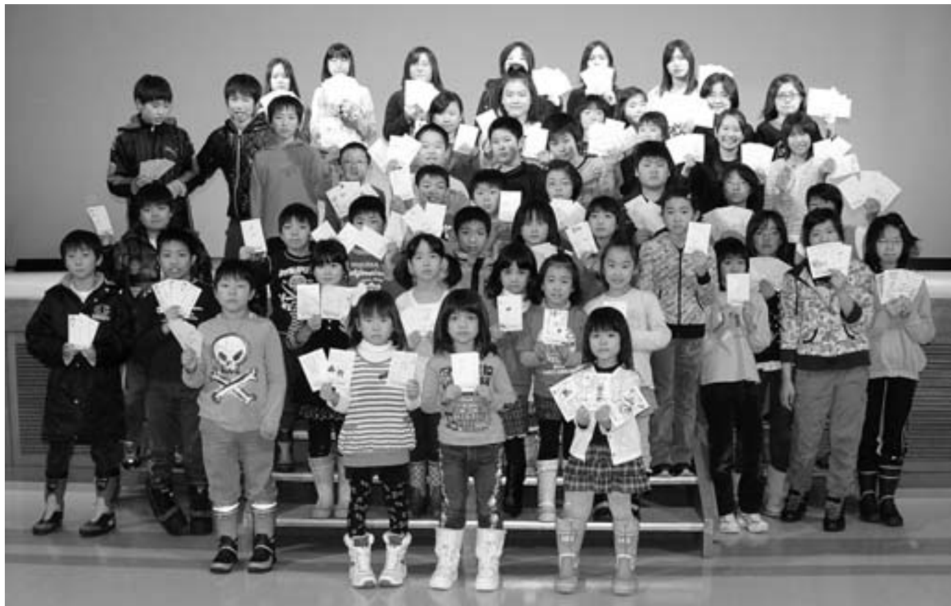
12月11日 子ども会年賀状づくり（恵み野ホール）