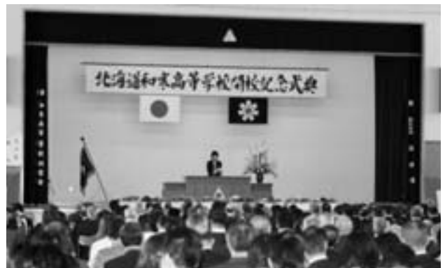
3月 和寒高等学校閉校記念式典