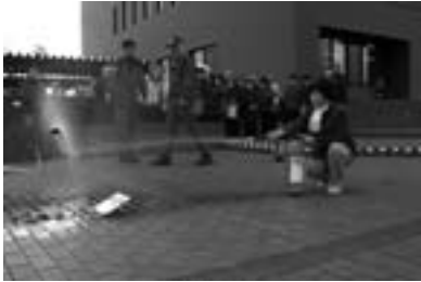
実際に消火器を使つての訓練

町では、自治会が行う防災研修会などの経費について助成を実施しています。詳しくは、役場総務課庶務係（TEL32-2421）までお問い合わせください。