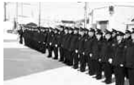
消防署前に整列する団員

また、その後行われた恵み野ホールでの式典では、功績章及び永年勤続の表彰が行われ、次のかたがたに表彰状が贈られました。