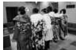
後ろ姿もきまってる