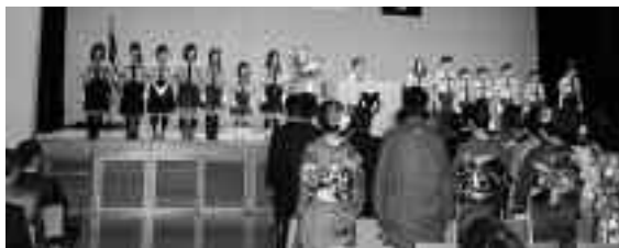
交通安全少年隊から新成人へ交通安全の呼びかけ