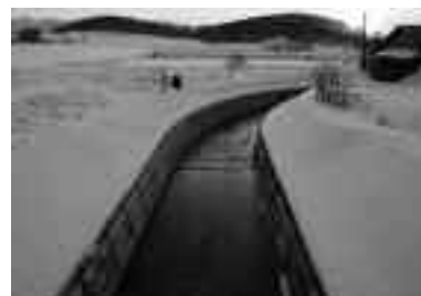
改修工事終了後の様子