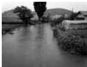
H23. 9月大雨により河川が増水している様子(万世橋付近)

町道バリアフリー化 町道改良工事 町道路面改修工事 町道等維持補修 橋梁長寿命化計画作成委託 六線川橋梁(瑞穂橋)架替事業負担金