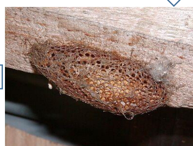
7~8月 まゆの時期 大きさは4cmくらい