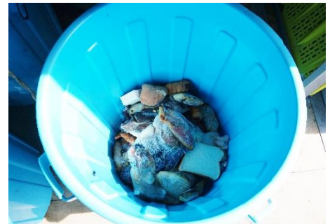
「冷凍の魚」と思われる ルール違反の投棄