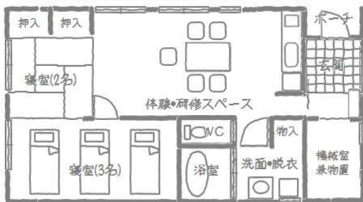
知寒町農村体験交流滞在施設エコテージ 平面図

また宿泊だけでなく、友人同士の食事会など日中のみの利用もできますので、まだ使ったことがないという方もぜひ一度ご利用いただき、親戚や友人にご紹介いただきますようお願いいたします。