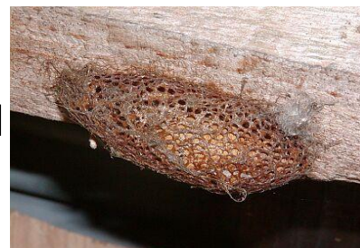
7月～8月 まゆ 繭の時期 大きさは4cm前後