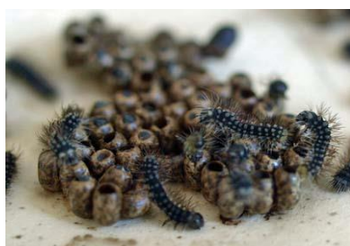
4月～5月 卵がふ化し、黒く1cmぐらいの大きさです