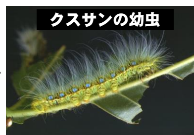
5月～6月 幼虫が数回の脱皮をしたのち、5cmぐらいの青白い幼虫に変化する