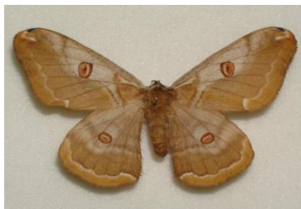
9月～10月下旬 成虫に羽化

・8月下旬～9月ごろ交尾して民家の壁や電柱、樹木に卵を産み、何も食べないで1週間から10日で死ぬ ・卵はそのまま越冬