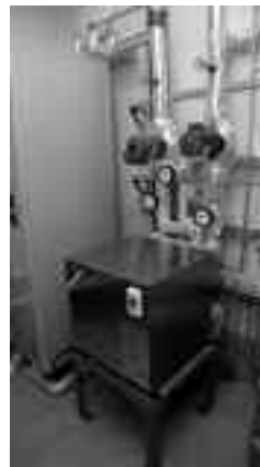
地中熱ヒートポンプ設備

室内にあるエコガイドモニターで太陽光発電量や消費電力、売電・買電量など様々な省エネ情報が見られます。