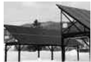
(上)太陽光発電パネル