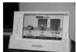
(下)エコガイドモニター