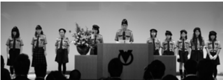
交通安全少年隊から交通安全の呼びかけ