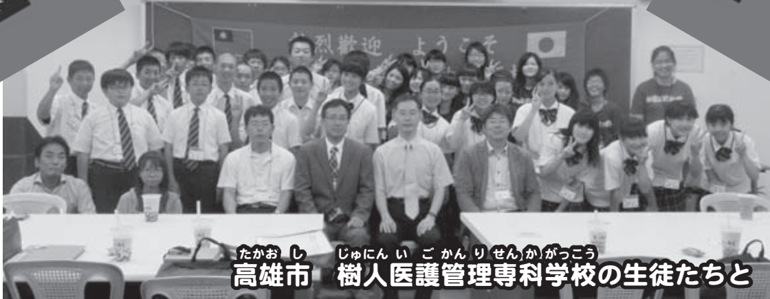
たかおし じゅにんい ごかんりせんかがっこう 高雄市 樹人医護管理専科学校の生徒たちと

8月8日から12日までの5日間、国際交流研修事業（町の「未来を拓く人づくり推進事業補助金」を活用して実施）で、和寒中学校2年生23名が台湾を訪れ、現地の学生と交流を深めながら生活や文化の違いに触れ、貴重な体験をしてきました。