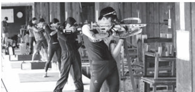
当麻町での射撃トレーニング