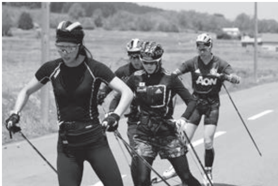
和寒町内でローラースキーやランニングなどの基礎トレーニングを行う選手