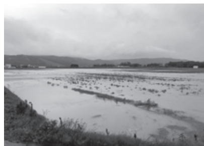
松岡 大豆畑の冠水(12線4号)