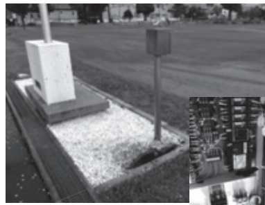
和寒小学校国旗掲揚塔横に落雷