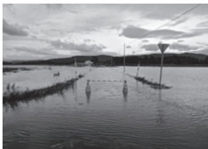
北原 冠水(町道11線4号~5号)