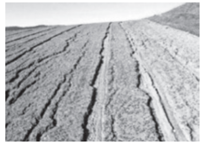
三笠 そば畑の表土流出