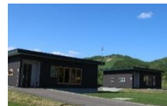
エコ・コテージ 【1棟8,400円～】

※宿泊施設は他にもございますが、体験メニューをご利用できるのは上記の施設をご利用になられた場合となります