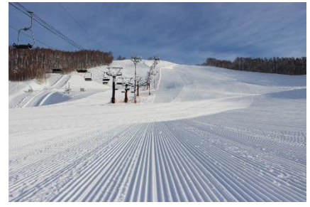
冬の東山スキー場