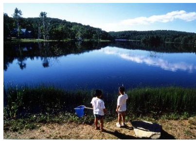
夏の南丘森林公園