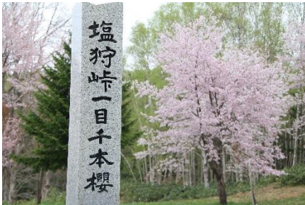
春の塩狩峠一目千本桜