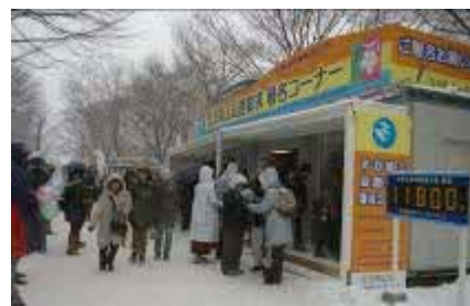
さっぽろ雪まつり会場での署名活動

また、1965年から始められた「北方領土返還要求署名」については、全国各地の関係団体などが積極的に署名活動に取り組んでおり、2020年3月時点での総署名数は9,000万人を越えています。