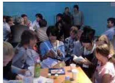
北方四島への訪問 (国後島での青少年住民交流)

北方領土問題が解決されるまでの間、相互理解の増進を図り、領土問題の解決に寄与することを目的として行われている旅券・査証なしによる日本国民と北方四島在住ロシア人との相互訪問事業で、1992年から事業実施団体が実施しています。