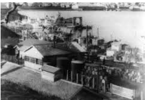
戦前の北方領土の様子（国後島・賑やかな頃の高釜布市街と湾）