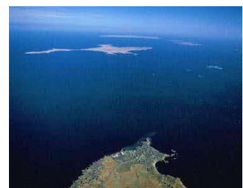
納沙布岬上空から見た歯舞群島

北方四島は、北海道本島の北東方に隣接して位置しており、一番近い歯舞群島の貝殻島は根室の納沙布岬から3.7kmしか離れていません。四島を合わせた総面積は約5,003km 2 で千葉県(5,157km 2 )や愛知県(5,173km 2 )の面積に相当します。