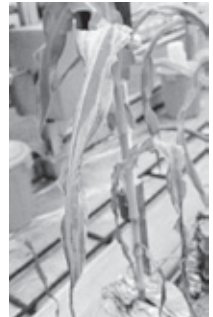
スイートコーンのリン酸欠乏

リン酸は、植物が光合成を促進するために重要な働きをしています。リン酸が足りなくなると下の葉が小さくまっすぐに立ち上がる症状が現れます。また葉の色は全体的に暗い緑色をして、成長が遅れ、症状が進むと枯れてしまいます。しかし、植物にとってリン酸が多すぎる場合、その症状はあまり明らかではありません。