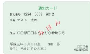
(表面) 通知カード (裏面)