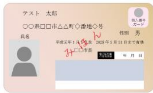
(表面) 個人番号カード (裏面)