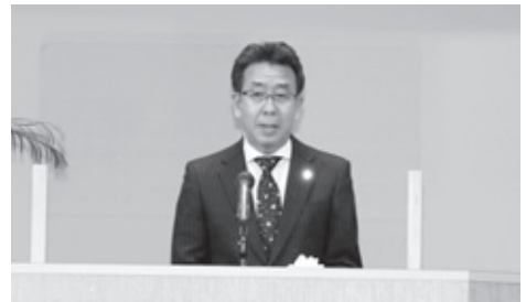
挨拶を述べる奥山町長

奥山町長から20人の出席者へ「人の痛みのわかる大人になってほしい」と挨拶を述べた後、佐々木議長からお祝いと激励のメッセージが贈られました。感染症対策のため縮小しての開催となりましたが、参加者の皆さんは、久しぶりに会った同級生と懐かしく、楽しいひと時を過ごし、二十歳を祝いました。