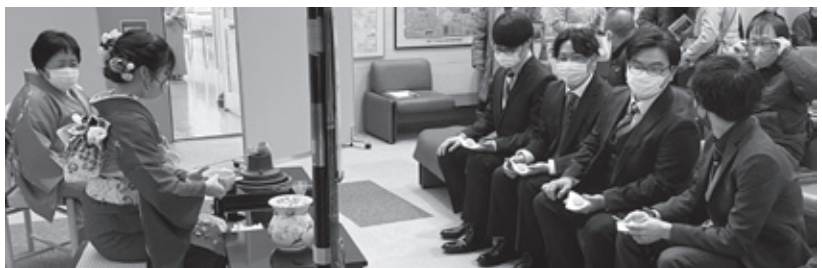
会の前段にお茶のおもてなし