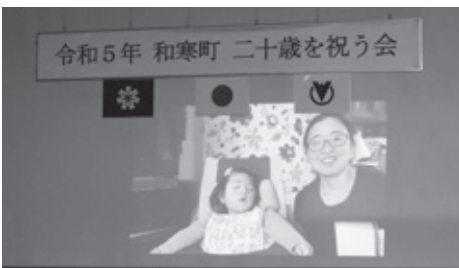
中学校時代の恩師からのビデオレター