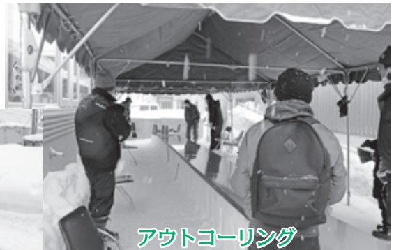
アウトコーリング アトラクションは大盛り上がり！