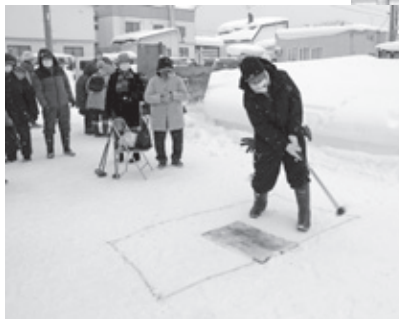
ニアピンコンテスト