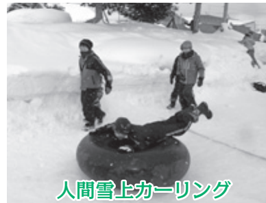
人間雪上カーリング