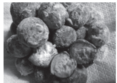
小学6年生とKAKUREが共同開発したかぼちゃ揚げドーナツ