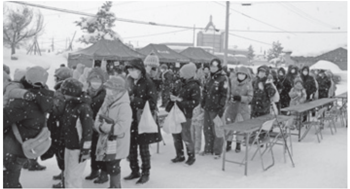
越冬キャベツ無料配布や食べ物ブースには長蛇の列！

2月5日（日）、役場周辺特設会場で「わっさむ冬まつり」が開催されました。これまでの極寒フェスティバルを、町民向けに会場を移し、規模を縮小して、3年振りの冬のイベントとなりました。