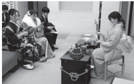
会の前段にお茶のおもてなし