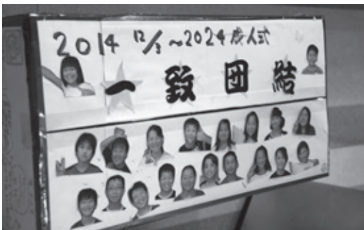
10年前 二十歳で開封を約束したタイムカプセル