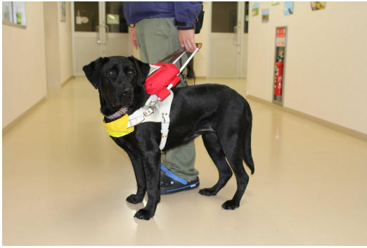
もうどうけん (盲導犬)