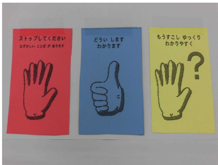
さす しよく (左図 3色カード)