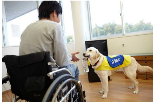
かいじよけん (介助犬)