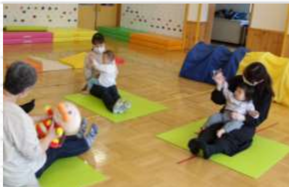
ママのお膝の上で、歌に合わせて「ゴーゴー！」