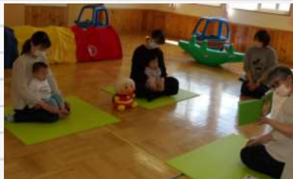
体を動かした後は、絵本を楽しんでいます。