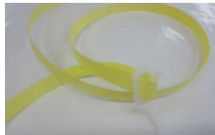
プラ製結束バンド