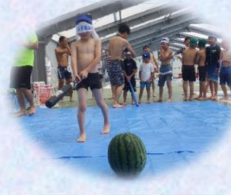
他にも、スイカ割りやポートなどで遊べます。