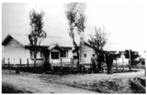
道庁立除虫菊試験地