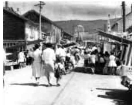
昭和34年駅前通り祭典

広報わっさむでは110年を記念し て先人たちの軌跡を1月号から引き続 きご紹介しています。 次号以降では、昭和中期から後期頃 の様子をご紹介します。