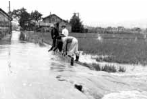
昭和31年大水害（北原）