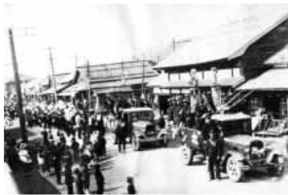
昭和8年春の火災予防パレード（大通り）